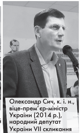
Олександр Сич, к. і. н., віце-прем'єр-міністр України (2014 р.), народний депутат України VII скликання