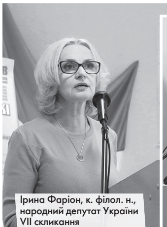
Ірина Фаріон, к. філол. н., народний депутат України VII скликання