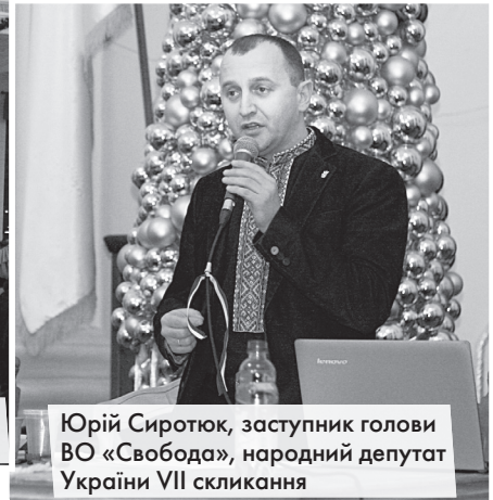
Юрій Сиротюк, заступник голови ВО «Свобода», народний депутат України VII скликання