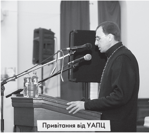
Привітання від УАПЦ