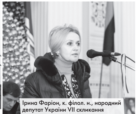
Ірина Фаріон, к. філол. н., народний депутат України VII скликання