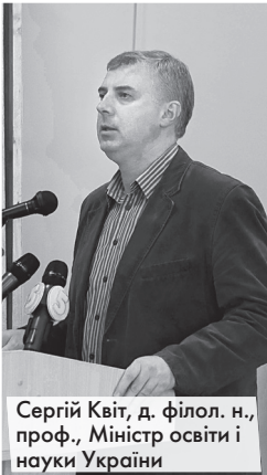
Сергій Квіт, д. філол. н., проф., Міністр освіти і науки України