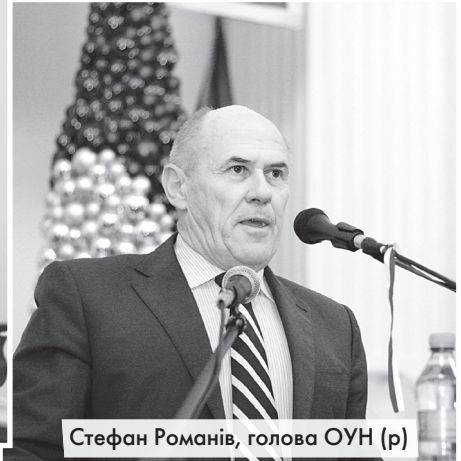
Стефан Романів, голова ОУН (р)