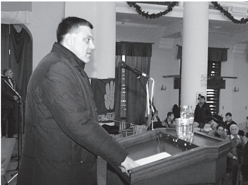
Олег Тягнибок, голова ВО «Свобода», народний депутат України III, IV та VII скликання