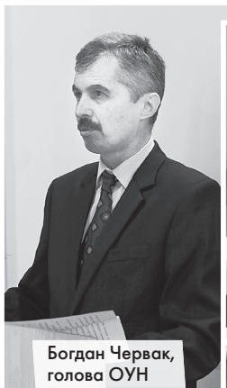
Богдан Червак, голова ОУН