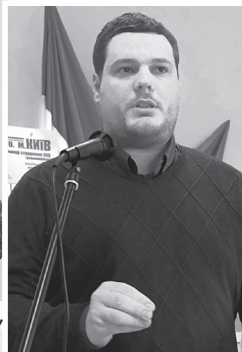
Андрій Ілченко, народний депутат України VII та VIII скликань