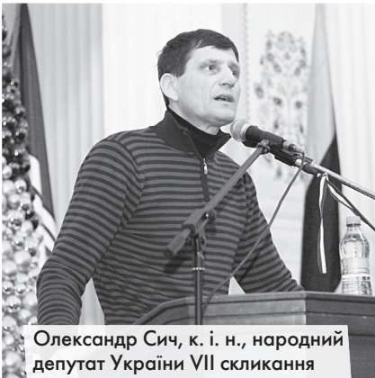
Олександр Сич, к. і. н., народний депутат України VII скликання