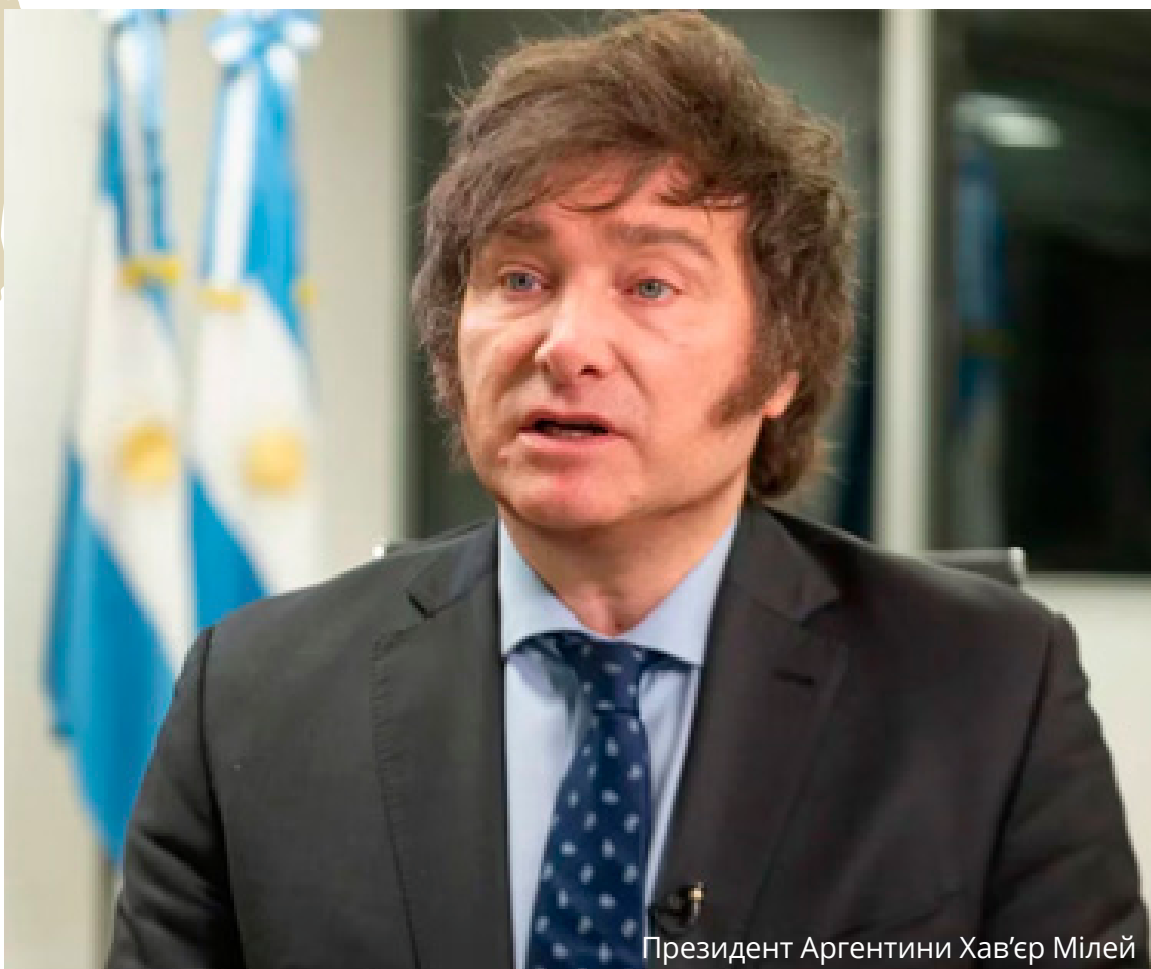
Президент Аргентини Хав'єр Мілей

Спалахи соціально-економічної нестабільності характерні фактично для всіх країн Латинської Америки. У 2022 р. у регіоні не залишилося великих держав із консервативними очільниками, однак у 2023 своєрідний економічний консерватор був обраний в Аргентині.